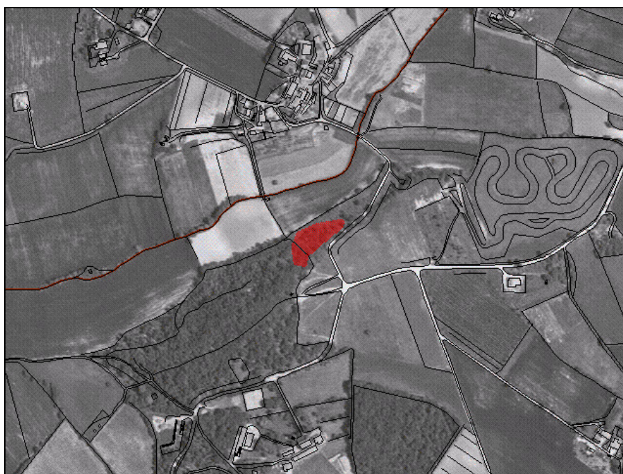
1:10000 Incendio boschivo n.0004M/03-2003 Inquadrimento Generale