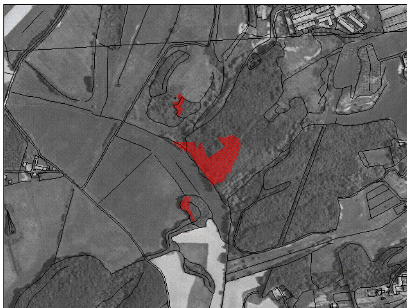
1:10000 Incendio boschivo n.0001S/01-2008 Inquadramento Generale