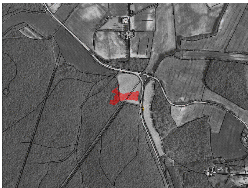
1:10000 Incendio boschivo n.0001S/01-2007 Inquadramento Generale