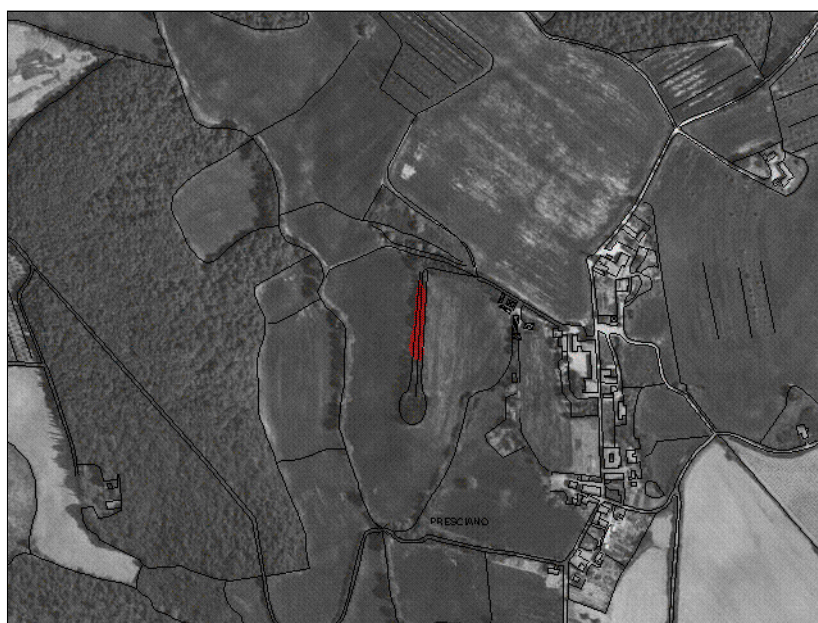
1:10000 Incendio boschivo n.0001S/01-2006 Inquadramento Generale